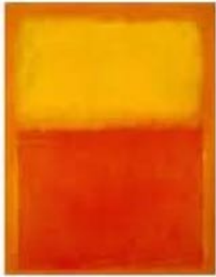
Orange and Yellow - Mark Rothko, 1956.