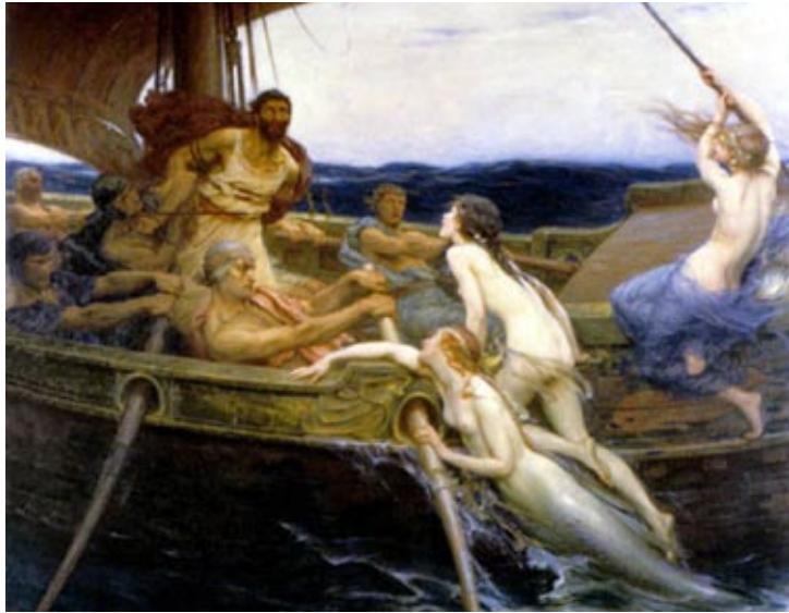
Odysseus slaat de raad van Circe om aan de betoverende zang van de Sirenen te ontkomen door wasproppen in zijn oren te stoppen, in de wind en laat zich vastbinden aan de mast – een mooi staaltje van zelfbeheersing. [Odysseus en de Sirenen – Herbert Draper, 1910]

overlegd en zij vechten dapper mee in de strijd. Zoals de Ilias begint met het woord mènis , wrok, en daarmee meteen het hoofdthema neerzet, zo begint de Odyssee met het woord voor man: anèr . Deze laatste gaat dan ook over de aard en de lotgevallen van een mens. Odysseus is een mentale krachtpatser, een onafhankelijk individu dat op de kracht van zijn hersenen moet overleven, door berekening en manipulatie. Een man die wordt gedreven door twijfel, nieuwsgierigheid en onderzoekingsdrang. In de Odyssee is het contact met de goden veel beperkter en grijpen zij vrijwel nooit direct in. Weliswaar geven zij Odysseus vaak raad, maar deze stelt zich veel onafhankelijker tegenover hen op en bedenkt en beslist vaak zelf hoe te handelen. Individualiteit en zelfbewustzijn vormen een hoofdthema, vaak in de vorm van verzet tegen verleidingen die stevast leiden tot identiteitsverlies of de dood.